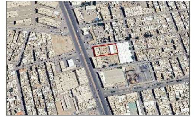
صور من الموقع