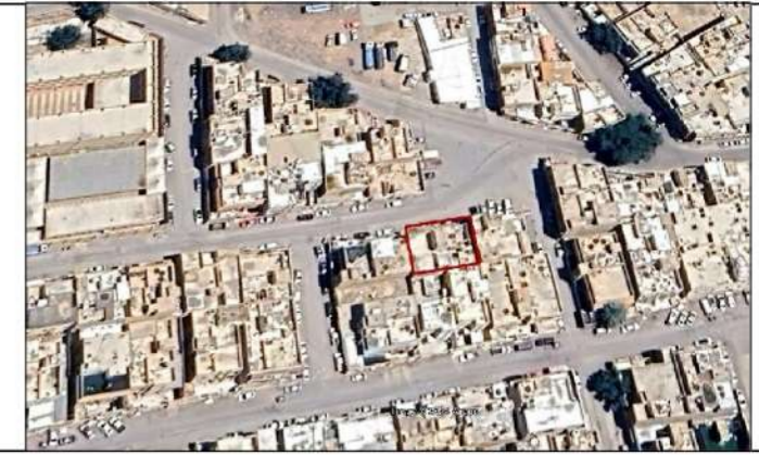
صور من الموقع