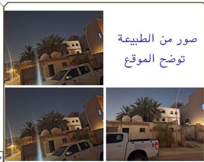
صور من الطبيعة توضح الموقع